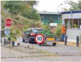
Eco-Station De Hemmen