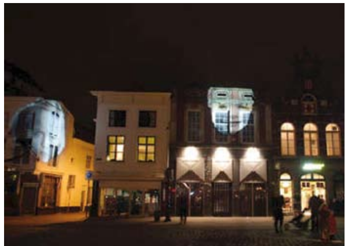
Geert Mul Lichtjaren Gouda 2006 i.s.m. SKOR