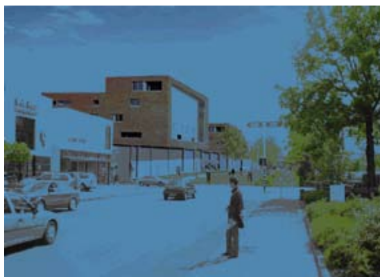
Impressie Mecanoo Bioscoop

Unieke combinatie van bioscoop, filmhuis en café als Noordelijke Entree Centrum