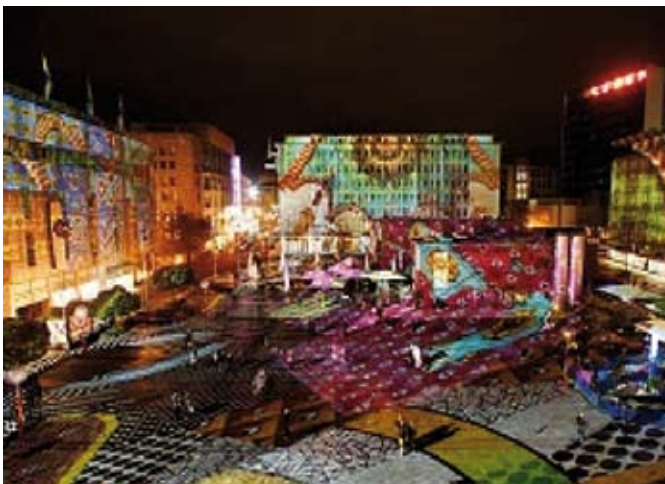
Peter Kozma Light Images 2006 Essen

Vergelijkbaar met de Lichtjaren-lichtroute die in december in Gouda plaatsvindt stellen wij voor een Lichtkunstbiennale te organiseren waarbij elke 2 jaar een aantal kunstenaars wordt uitgenodigd een tijdelijke lichtinstallatie te maken in het centrum en wat ons betreft ook in (één van) de dorpen.