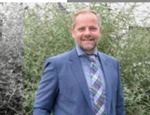
Wethouder Pieter van der Zwan (ChristenUnie)